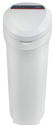
AquaHome 30 SMART