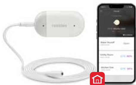
Detector de inundație și îngheț Braukmann L1 WiFi

Împreună, aceste produse le oferă clienților mai multă siguranță, alertându-i în cazul scurgerilor sau conductelor înghețate. În plus, vana de închidere reduce potențialele daune survenite în locuință. Aceasta poate fi gestionată de pe un smartphone, prin intermediul aplicației Resideo, fiind astfel o soluție de neratat pentru proprietarii de locuințe pasionați de tehnică din zilele noastre.