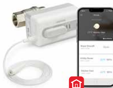
Vană de închidere anti-inundație L5 WiFi